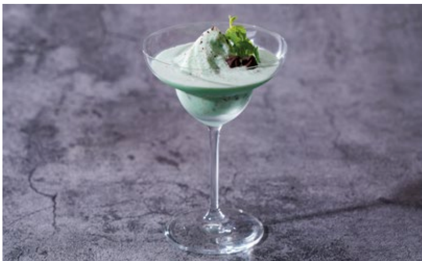
チョコミントフローズン Chocolate Mint Frozen

Milk, Chocolate, Vanilla Frappe Base, Peppermint Syrup, Salt