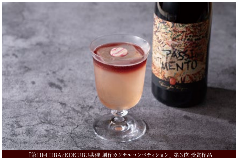
「第11回 HBA/KOKUBU共催 創作カクテルコンペティション」第3位 受賞作品