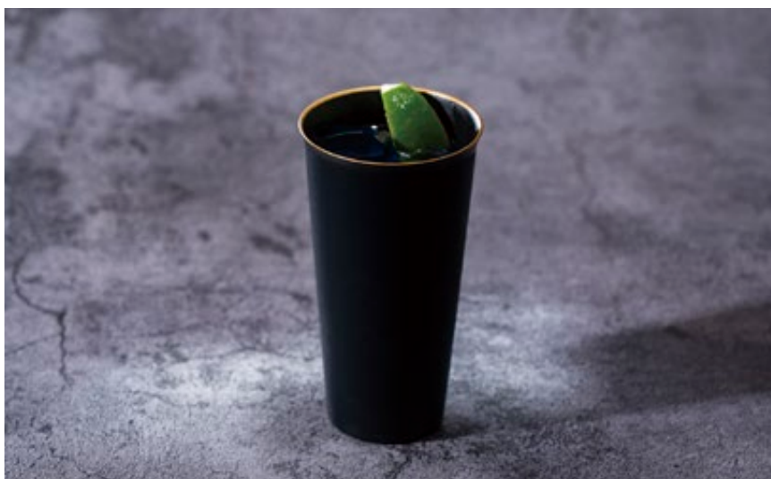
ゼロジントニック Zero Gin & Tonic

濃厚なバニラと香り高いペパーミント、コク深いチョコレートを使ったデザートドリンク。 隠し味に塩を加え、よりハーブの心地良い清涼感を増幅させた“大人のチョコミント”。