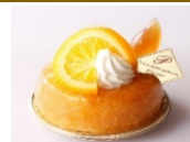
サヴァラン オロム