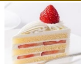
苺の ショートケーキ

Cake set: your choice of cake with coffee or tea