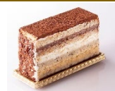
ガトー マルジョレーヌ