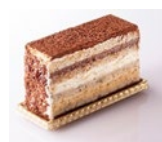
ガトーマルジョレース