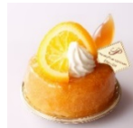
サヴァラン オロム