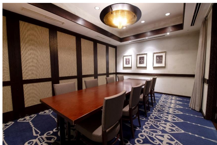
《ミーティングルーム》