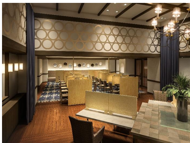
《落ち着いた雰囲気ワーキングエリア》