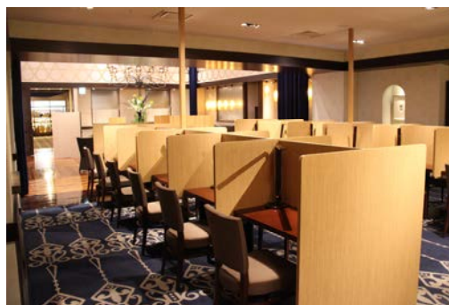
会員制サテライトオフィス 「KEIO BIZ PLAZA 新宿・都庁前」