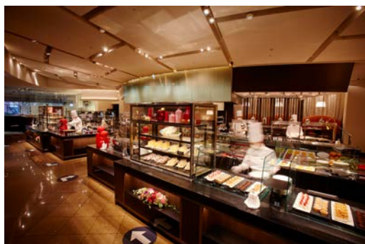
スーパーbuffet<グラスコート>