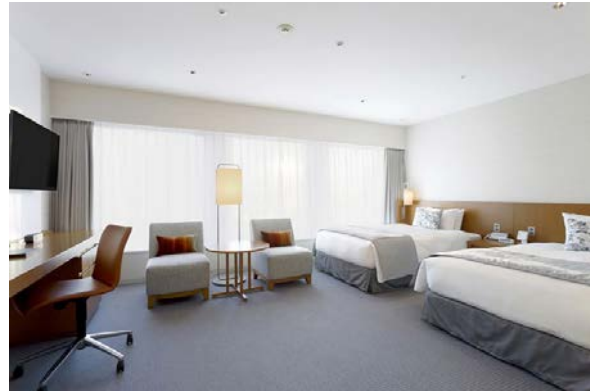
画像左) 改装スタンダード 画像右) 改装スーパーリア 画像下) 改装デラックス